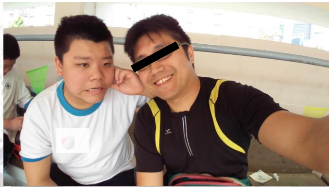
■即使怎樣，老師常與你同在