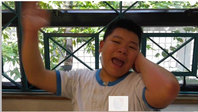
■情緒起伏大，失控時會大叫、打自己、甚至打人