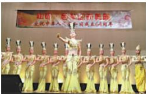
▲中國殘疾人藝術團的二十位團員，分別表演了音樂舞蹈、手語舞蹈以至馳名中外的《千手觀音》等節目