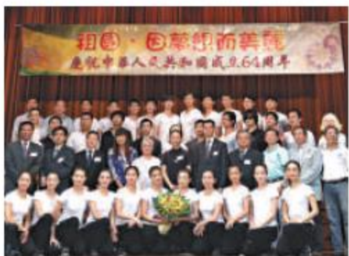
▲勞工子弟中學與中國殘疾人藝術團，共同開展名為「祖國，因夢想而美麗」的國慶活動