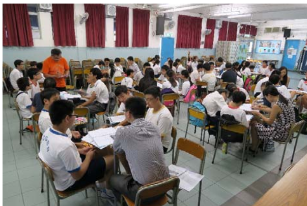
小組導修，提升同學的多個共通能力。