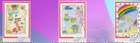
初小組「長洲·寶藏」填色及圖像創作