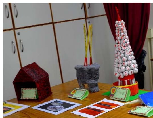
以「長洲藝術與文化」為專題研習主題，製作立體紙雕藝術品。