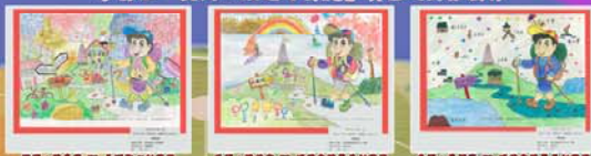
學前組「長洲·旅遊好去處」填色及圖像創作