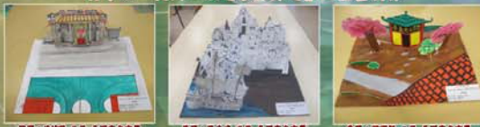
初中組「長洲·旅遊景點彈起」立體畫創作