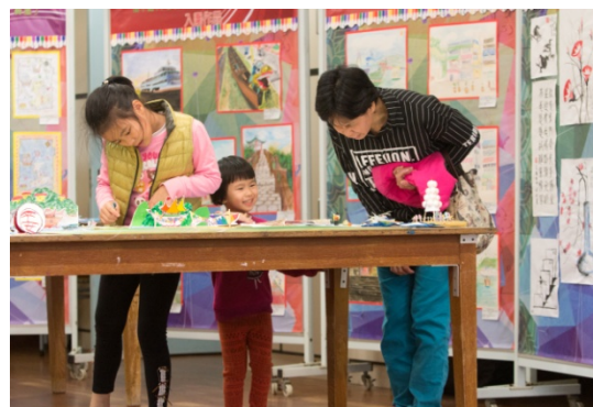
島上學校踴躍參加，作品已於3月在開放日中展出。