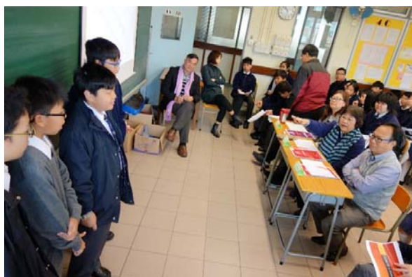
匯報研習內容，提升協作和溝通等能力。