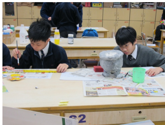
製作立體紙雕，提升同學創造力。