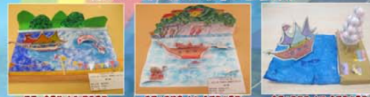
高小組「開往長洲的船」立體畫創作