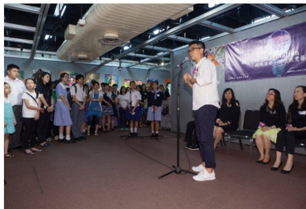
2016年的主題為「超越想像」(Beyond Imagination) 聯校視覺藝術創作展2016