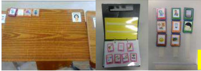
溝通輔具版面例子