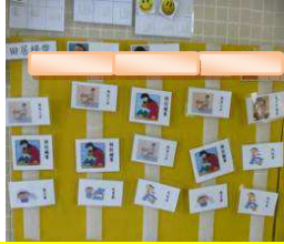
有系統圖像化溝通