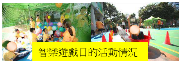
智樂遊戲日的活動情況

為建立教師團隊對遊戲在教學及學習中的應用，本年度加入智樂遊戲日，為參與者（教職員、學生、義工及家長）提供一個多元化的遊戲平台，促進參加者之間互動交流，從多鼓勵多讚賞，脫離了正規課堂的嚴肅要求，而在一個輕鬆的遊戲情景下，建立良好師生關係。另透過不同型式的活動，激活能力稍遜的學生參與及互動的動機，而對於能力較高的學生則可以增強創意、挑戰自己，以及遊戲互動主動性（邀請別人一起玩）。學生可於自由活動時間，選擇自己喜愛的活動，感受到從遊戲中可得到的歡愉。