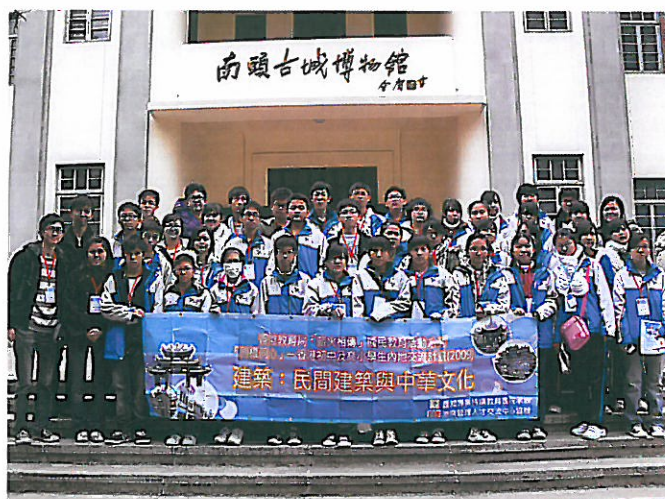
廣州團嶺南建築及中華文化之旅