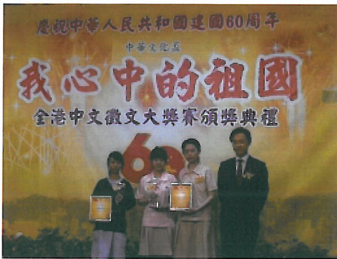
我心中的祖國徵文比賽高中組三等獎及最積極參與學校獎