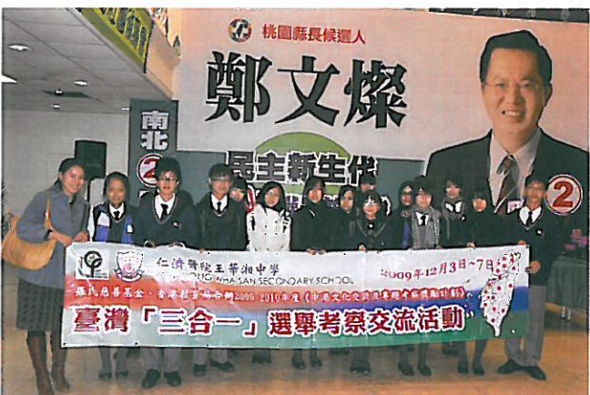
台灣三合一選舉考察交流團