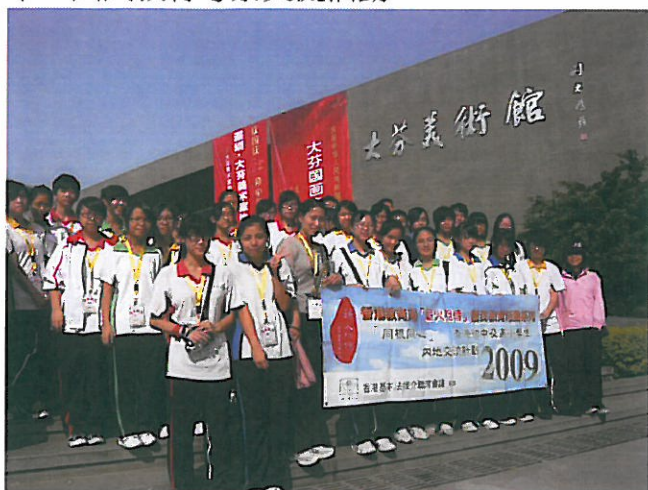
「歷史：改革開放前後的變遷」交流團