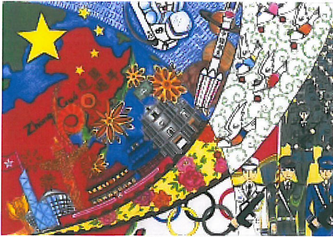
建國六十周年書籤設計比賽」高中組亞軍