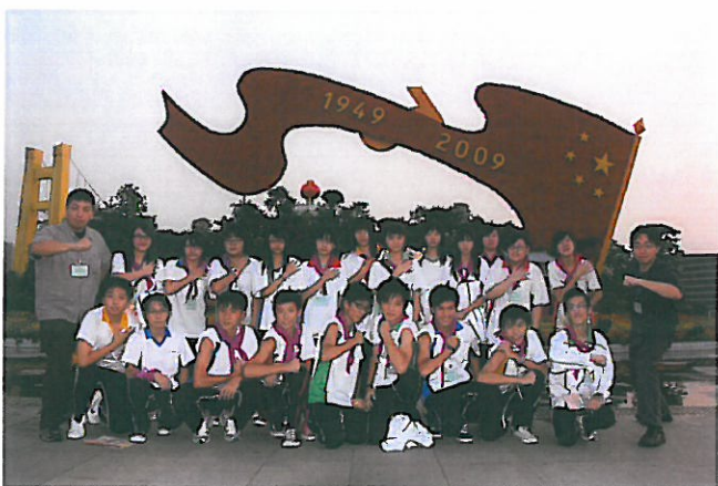
「經濟：城市規劃與多元發展」交流團