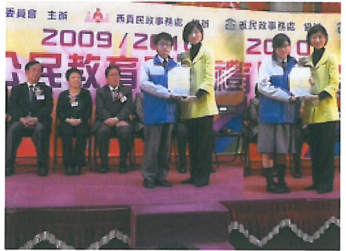
國慶六十周年繪畫比賽冠軍及亞軍