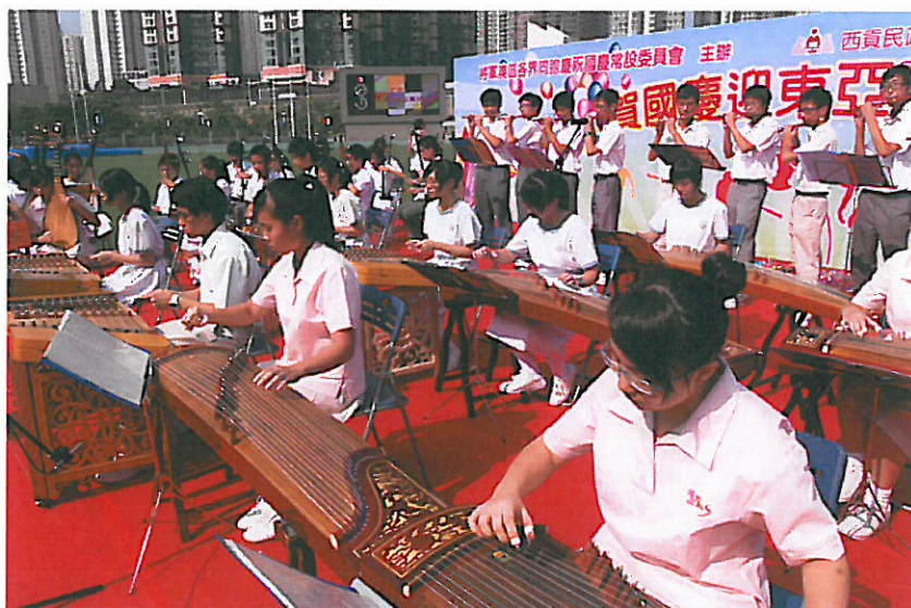
賀國慶迎東亞表演