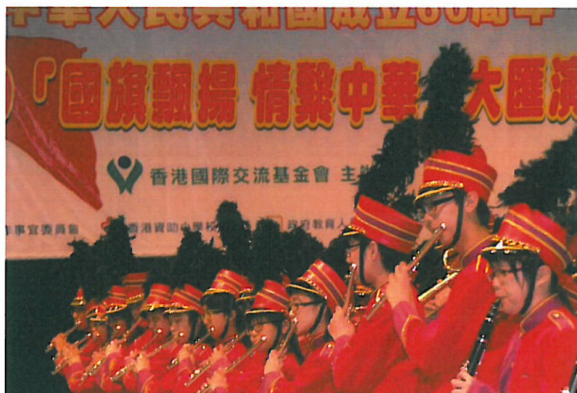
2009 國旗飄揚情繫中華大匯演