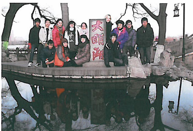
山東教育考察之旅