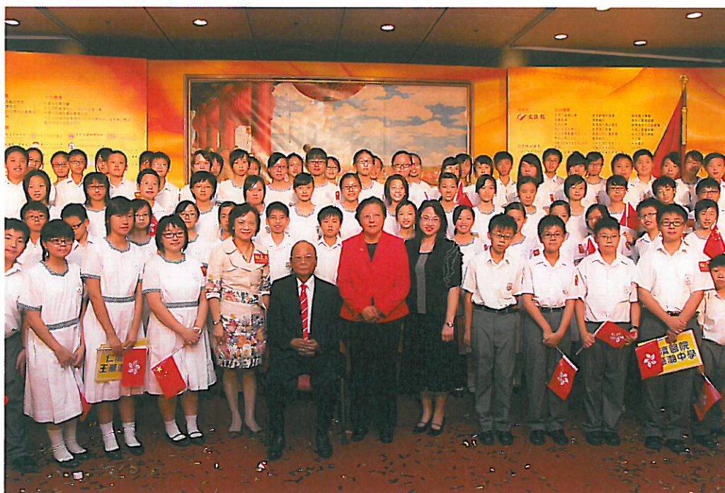
「開國大典圖片文物回顧展」精英合唱團表演