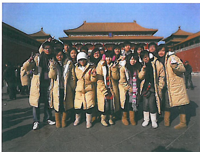
北京南京考察交流團