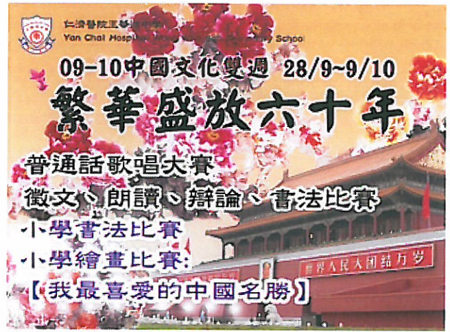
中國文化雙週 2009-10 繁華盛放六十年